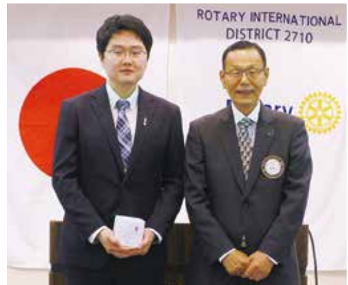
米山奨学会 博士号取得記念品授与